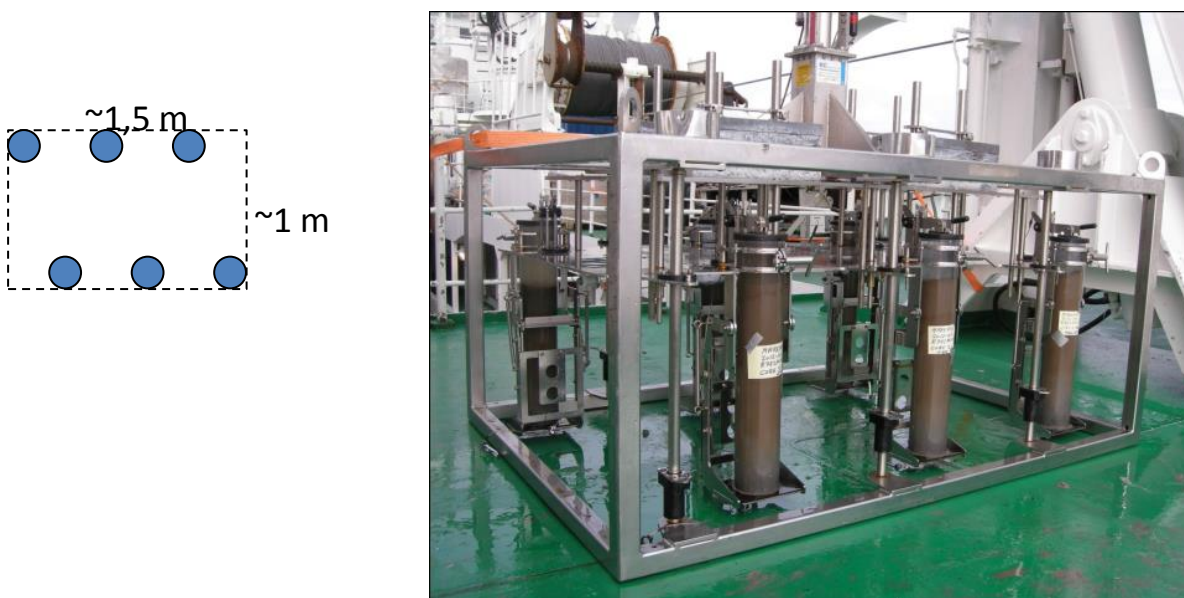
Figur 1. Bildet viser multicorerer på dekk etter prøvetaking. Skissen viser dimensjoner og relativ plassering av 6 kjerner.

Multicorer benyttes for kjerneprøvetaking og gir 6 sedimentkjerner av opptil ca. 50 cm lengde (figur 1). Alternativt kan bokscorer benyttes for prøvetaking (figur 2), og man får 4 – 6 (noe kortere) kjerner fra bokscoreren. Det er nødvendig med flere kjerner, siden forskjellige analyser krever forskjellig forbehandling av prøvene, og fordi det kreves mye materiale til de forskjellige analysene.