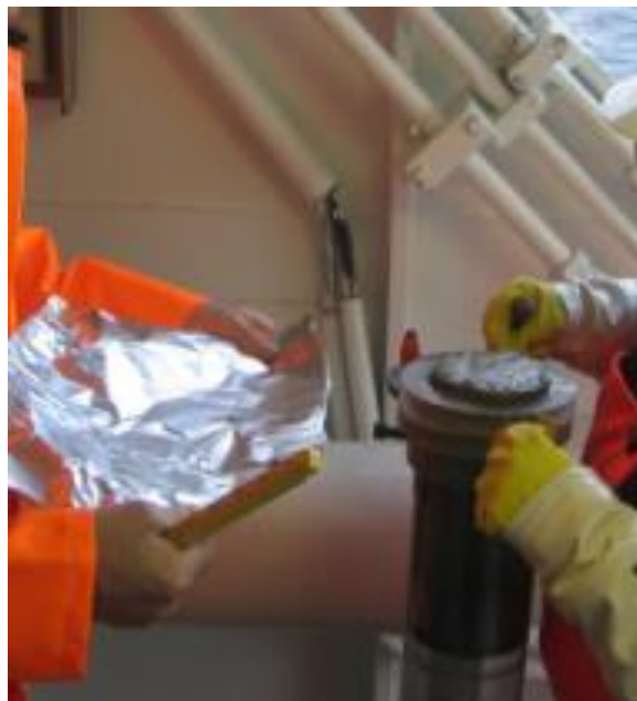
Figur 5. Øverste 1 cm av sediment-kjerne stikker opp av kjernesliver. Overflate prøve for organiske analyser.